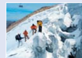
Aventura no gelo

1. Titlis Glaciar Station (Estação Glaciar de Titlis). Um terraço com vista deslumbrante, cinco restaurantes, lojas e diversas opções de entretenimento.