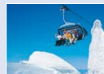
Telecadeira Ice Flyer