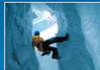
Descida em rappel de escarpas