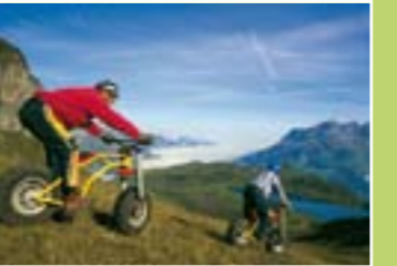
Devil Bike (bicicleta especial)

2. Trübsee (alt. 1800 m / 5900 pés). Trilhas para caminhar ou passear de charrete em volta do Lago Trübsee. Restaurante: Trübseehof.