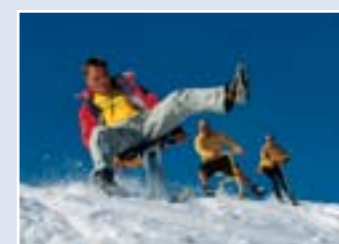
Brinquedos para a neve no parque glaciár