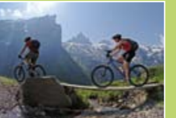
Bicicleta de montanha

Caminhada/Bicicleta de Montanha. A pé ou de bicicleta, usufrua dos quatro lagos no caminho de Trübsee para Engstlenalp, Tannensee e Melchsee-Frutt.