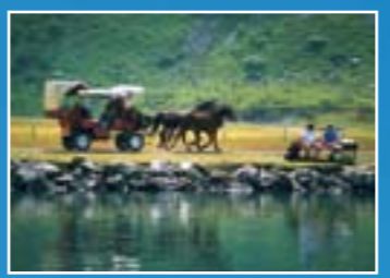
Carroça puxada a cavalos