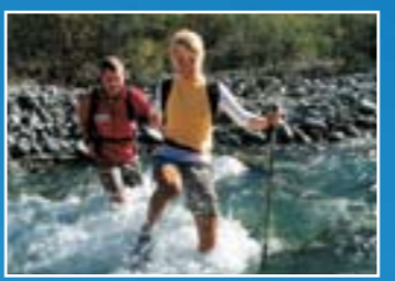
Passelos a pé