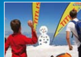
Diversão na neve