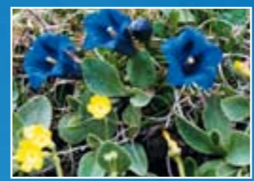
Trilha das flores de montanha