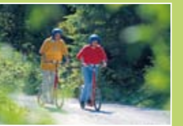
Trotti Bike (bicicleta especial)

1. DESTAQUE Trotti Bikes. Desça as veredas entre Gerschnialp e Engelberg, em grande velocidade ou com toda calma, com estas divertidas bicicletas. Pode alugá-las na estação de Gerschnialp.