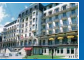
Hotel Terrace em Engelberg