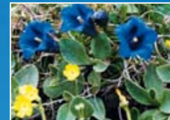
Mountain Flower Trail