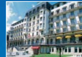
Hotel Terrace di Engelberg