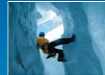
Crevasse Abselling (menuruni crevasse)