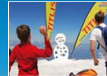
Keceriaan di Salju