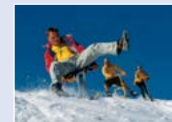
Snow Toys Taman Glasier

4. HIGHLIGHT Taman Glasier Titlis. Meluncur dengan Snow Tube menuruni jalur salju yang sudah dipersiapkan. Atau coba berbagai macam pilihan Snow Toys, seperti: Balancer, Snow-Scoot dan Snake Gliss. Salju belum pernah seasyik ini!