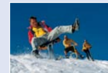
เครื่องเล่นลานหิมะนานาชาติที่สวนอุทยานธารน้ำแข็ง

4. สิ่งที่คุณไม่ควรพลาด สวนอุทยานธารน้ำแข็งทิตลิส สนุกสนานกับการสโนว์โกลไปบนหวงยางตามทางหิมะที่จัดไว้ หรือคุณอาจลองเครื่องเล่นหิมะสวรูปดรูบบบ อาทิ เครื่องเล่นต่างๆ ได้แก่ บาลานเซอร์ สโนว์สเก็ต และ