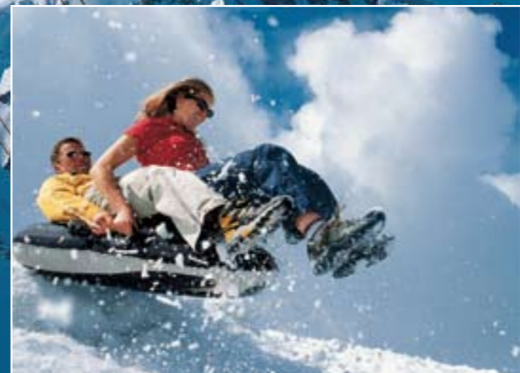
สวนอุทยานธารน้ำแข็งหรือ Glacier Park