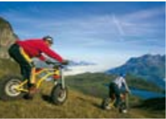
จักรยาน Devil Bike

2. เมือง Trübsee (ที่มีความสูงจากระดับน้ำทะเล 1800 เมตร / 5900 ฟุต) ทางใต้เขาและล้อมรอบทะเลสาบ Trübsee ภัตตาคาร Trübseehof