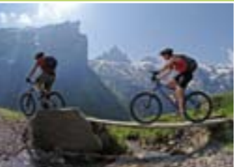
จักรยานเสือภูเขา

4. การขี่จักรยาน Devil Bike สัมผัสประสบการณ์แบบออฟโรดบนทางลาดชันอันน่าตื่นตะลึง จากเมือง Jochpass สู่อิง Trübsee คุณสามารถเช่าจักรยานได้ที่ Jochpass