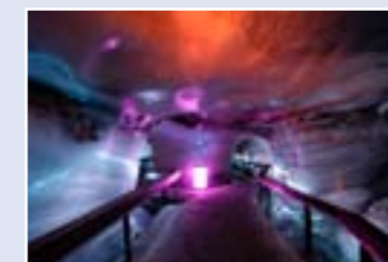
ถ้ำน้ำแข็ง

1. สถานี Titlis Glacier ขึ้นชมทัศนียภาพอันงดงามของแสงอาทิตย์ที่เริ่มลับขอบฟ้าที่บริเวณระเบียง นอกจากนี้ยังมีภัตตาคารถึง 5 แห่ง ร้านรวงต่างๆ ละสิ่งบันเทิงอื่นๆ อีกมากมาย