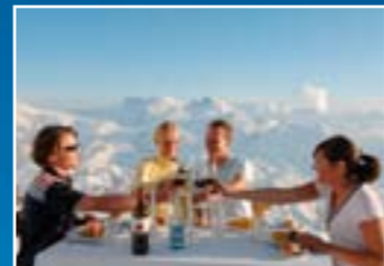
ภัตตาคาร