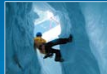
การไต่ผาด้วยเครื่องมือของธารน้ำแข็ง