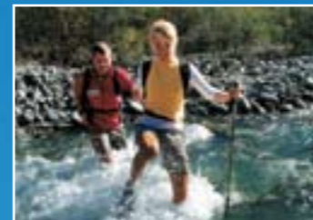
การคายัค