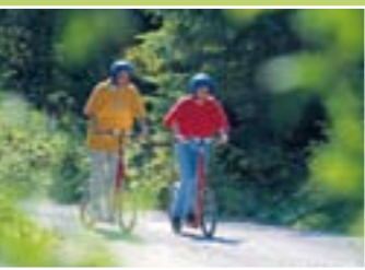
จักรยาน Trotti Bike

1. สิ่งที่คุณไม่ควรพลาด จักรยาน Trotti ที่คุณจะมีบังคับให้เร็วหรือช้าก็ได้ สนุกสุดเหวี่ยงกับการขี่จักรยานสองล้อไปตามเส้นทางระหว่างเมือง Gerschnialp และ Engelberg คุณสามารถเช่าจักรยานได้ที่สถานี Gerschnialp