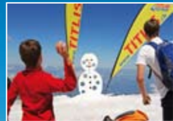
สนุกเพลิดเพลินกับหิมะ