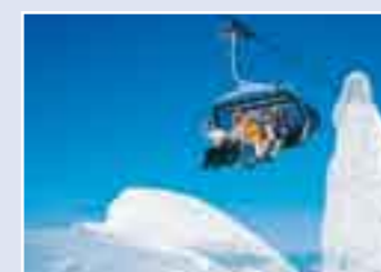
Ice Flyer Sessellift