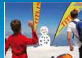
Spass im Schnee