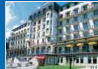
Hotel Terrace in Engelberg