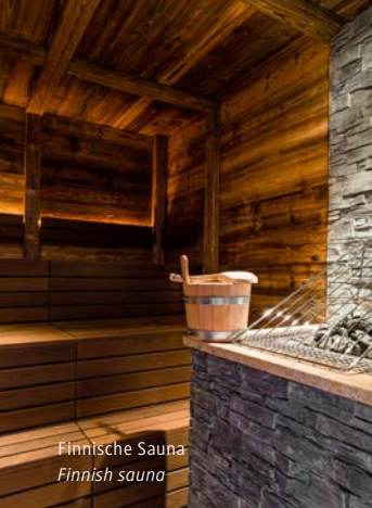
Finnische Sauna Finnish sauna