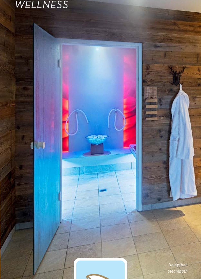
Dampfbad Steam bath