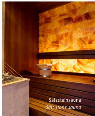
Salzsteinsauna Salt stone sauna